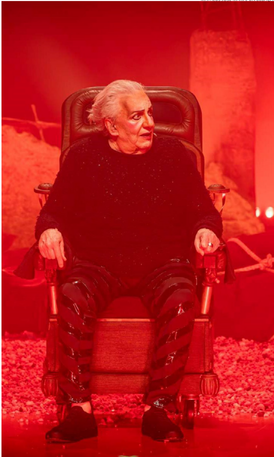
Marco Nanini se tornou nas últimas décadas um dos mais respeitados atores

Em entrevista ao jornal Diário da Manhã , Nanini expressa seu entusiasmo por retornar ao trabalho com Gerald Tho-