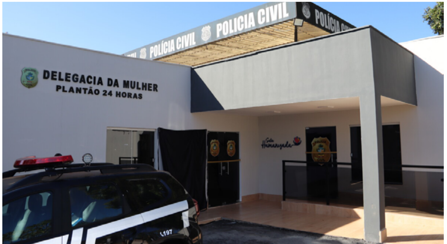
A prisão do suspeito foi um desdobramento importante na investigação de outros crimes patrimoniais ocorridos recentemente na cidade

Imediatamente, a equipe do GEPATRI iniciou diligências para identificar e localizar o autor do crime. As primeiras ações da investigação incluíram a análise de imagens de câmeras de segurança instaladas nas proximidades da residência invadida. As gravações forneceram pistas valiosas sobre a identidade do suspeito. No mesmo dia, a polícia foi informada sobre um novo furto ocorrido em