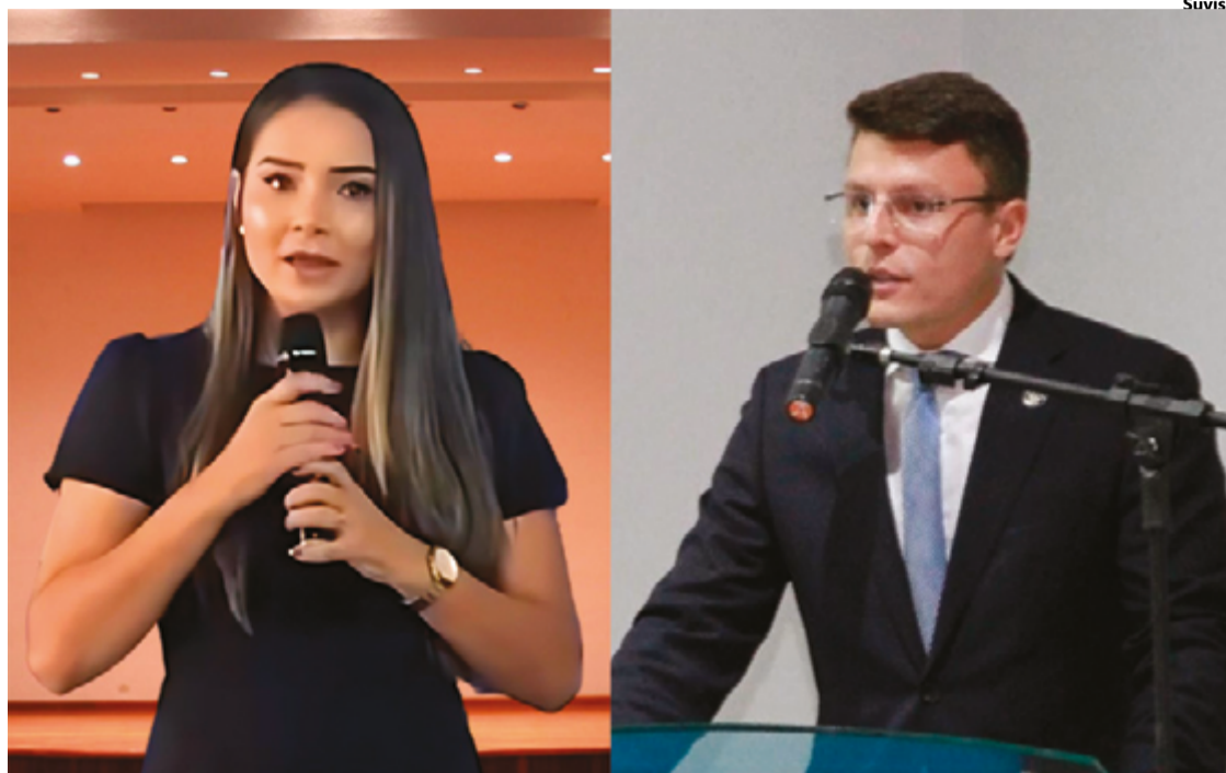
Sistema de Informação da Mortalidade indica 1.570 óbitos por sinistros de trânsito em Goiás no ano passado

O encontro, promovido pela SES-GO em parceria com a Se-