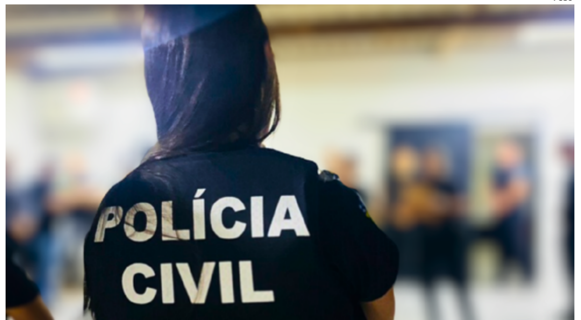
A prisão foi efetuada pela Polícia Militar, após uma denúncia anônima que alertou as autoridades

sob proteção policial, receberá o apoio necessário para sua segurança e bem-estar. Já