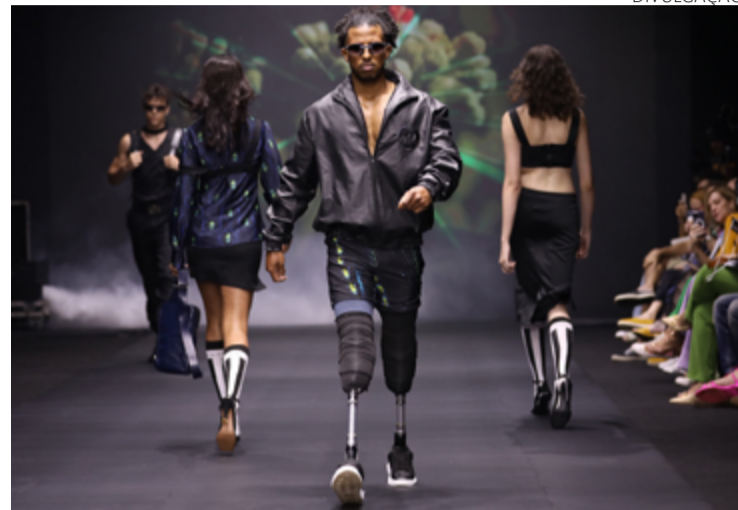
Amarê se concentra em trazer inclusão para ambiente fashion goiano