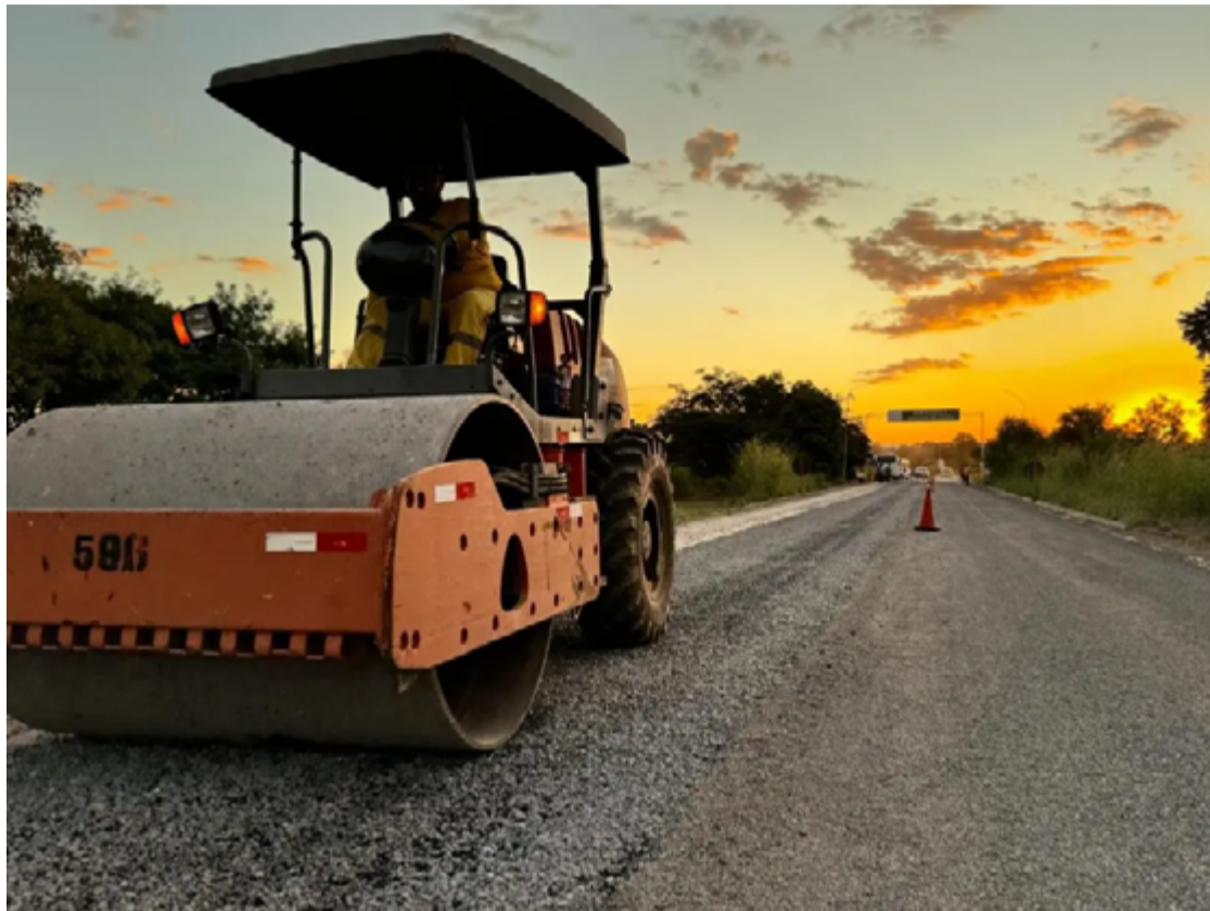
Evento discutiu como problemas na Mobilidade afetam sistema de saúde.

O contrato terá duração de três anos, com possibilidade de prorrogação até o prazo total de cinco anos. Interessados podem acessar o edital