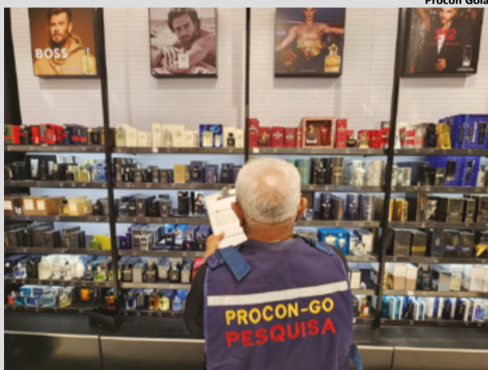
Pesquisa contou com 70 itens mais procurados para presentes para o papai

do pela CDL (Câmara de Dirigentes Lojistas) Goiânia expôs que cerca de 650 mil consumidores goianienses vão às compras na capital e o valor médio gasto por presente será em tor-