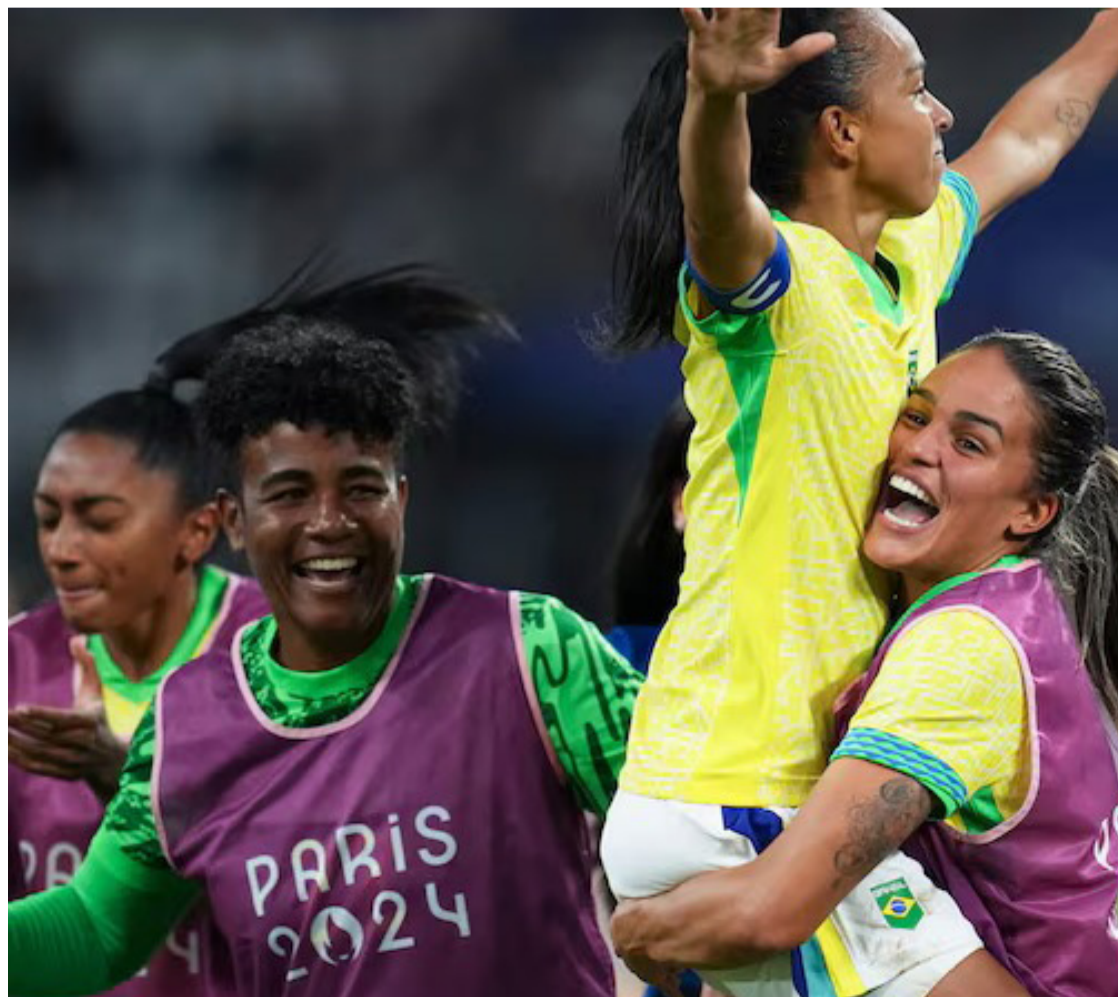
Esta será a terceira vez que o Brasil disputa uma final olímpica no futebol feminino

A seleção brasileira feminina de futebol mostrou resiliência e talento ao superar a Espanha e garantir um lugar na final olímpica após 16 anos. A partida contra os Estados Unidos promete ser emocionante, com um clima de revanche e a possibilidade de conquistar o tão sonhado ouro olímpico.