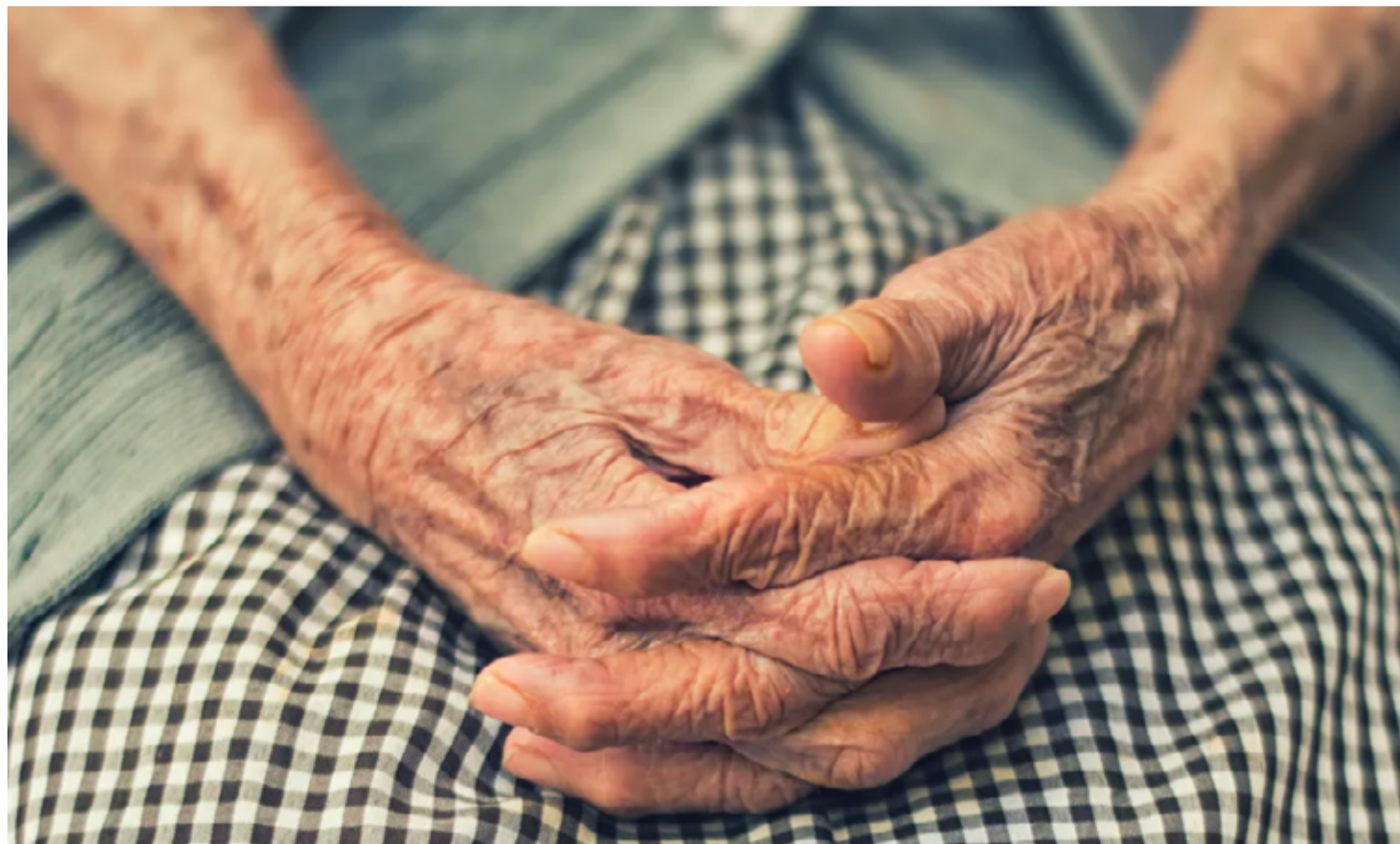
A idosa, com a ajuda de uma vizinha, foi até a delegacia para registrar a ocorrência

A idosa, com a ajuda de uma vizinha, foi até a delegacia para registrar a ocorrência, relatando que vinha sendo vítima de constantes agressões verbais e físicas, além de ameaças feitas por seu filho. Segundo o relato, o homem não apenas a insultava e ameaçava com frequência, mas também a submetia a humilhações extremas. No incidente que culminou na prisão, o acusado xingou a mãe, ameaçou matá-la e tentou forçá-la a enfiar a cabeça dentro de um vaso sanitário, configurando uma situação de extrema violência e desrespeito.