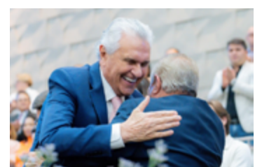
Ronaldo Caiado parabeniza bispo Oídes, da Assembleia de Deus, pelos 71 anos

1958, com a direção do pastor Albino Gonçalves Boaventura. Hoje, trata-se de uma rede de mais de 450 igrejas espalhadas na região metropolitana de Goiânia e no estado de Goiás. Em 2002, o bispo Oídes assumiu o cargo de pastor presidente da instituição religiosa em Goiás.