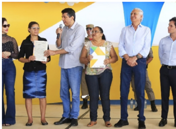
Governador Ronaldo Caiado entrega cartões e escrituras em Posse: ações em várias frentes

Em discurso às famílias contempladas, Caiado reiterou que