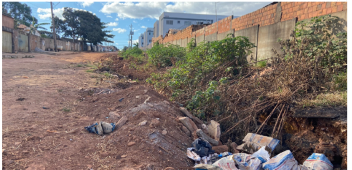
No Setor, o cenário é de ruas esburacadas e, em grande parte, sem qualquer pavimentação

Os residentes do setor relatam que o estado das ruas não apenas afeta a qualidade de