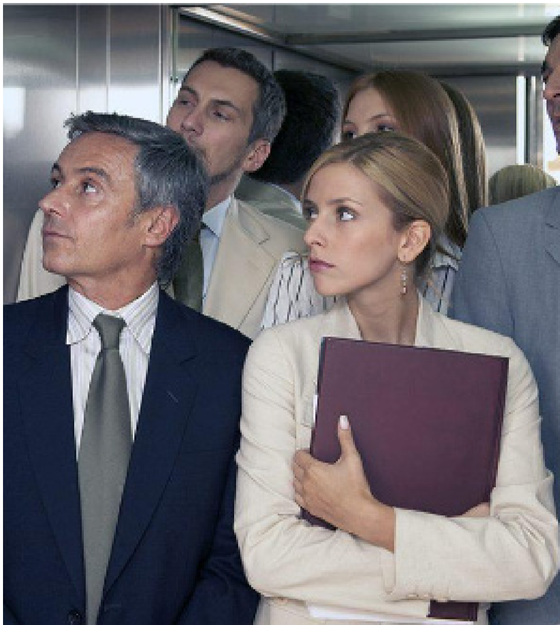
Conversa fiada entre desconhecidos deve ser evitada

O elevador é um local onde as pessoas não devem conversar. A vida pode ser mais prazerosa se incorporarmos pequenas atitudes que podem fazer a diferença no dia a dia. Ser cortês em qualquer lugar fará com que seja bem-visto e respeitado. A verticalização das cidades exige das pessoas uma nova postura - como se portar nas rápidas viagens de elevador, seja em prédios residenciais ou profissionais. Deslizes de comportamento ocorrem de maneira sistemática nos rápidos minutos em que se permanece em espaço tão minúsculo, tão privado e ao mesmo tempo tão público.