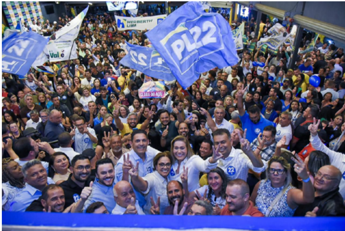
Após rumores sobre apoio do partido de Jair Bolsonaro a outro nome, PL confirmou ontem candidatura de Zé Antônio

Confirmada na convenção como candidata a vice-prefei-