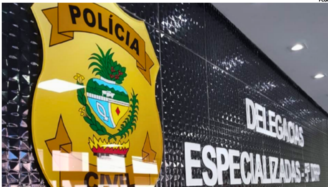
A equipe da Delegacia Especializada iniciou diligências para localizar e deter o acusado.

Segundo informações divulgadas pela polícia, a vítima, que já havia solicitado medidas protetivas de urgência, informou que o acusado vinha ignorando as determinações judiciais, ameaçando-a repetidamente. O caso ganhou contornos ainda mais graves no último dia 3 de agosto, quando o agressor encontrou a mãe da vítima e a